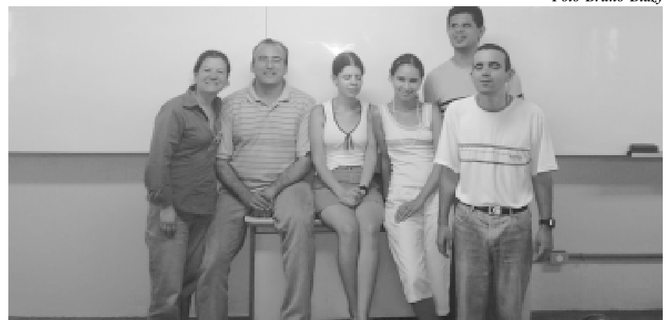
Alguns componentes do nosso grupo

Essa anormalidade e diferença estão espalhadas por diversos lugares dentro da USM, principalmente na clínica de Psicologia, na qual são tratadas. Mas e aquelas que estão nas salas de aula? Estas são, quase sempre, tratadas com indiferença, ignorância e falta de atenção para com suas deficiências, sejam física, sensorial ou mental. Pessoas que procuram a Universidade, não pela porta da clínica, por